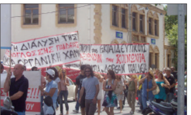
στις παραπάνω κινητοποιήσεις σημειώνει ότι κοινή είναι η ανησυχία και η συμφωνία για την έναρξη κινητοποιήσεων προκειμένου «να μην χαθεί άλλος πολύτιμος χρόνος! Τα βάρη που καθημερινά προστίθενται στην, έτσι κι αλλιώς βεβαρημένη, ζωή των Ατόμων με Αναπηρία και

μέρος και όλοι οι τοπικοί σύλλογοι των Α.με.Α. (Παγκιακός Σύλλογος Ατόμων με Αναπηρία, Σύλλογος γονέων και κηδεμόνων Ατόμων με αναπηρίες Ν. Χίου, Π.Ο.ΑμεΑ.Βορείου Αιγαίου κλπ), οι εν ενεργεία και συνταξιούχοι Ναυτικοί (Π.Ε.Σ./ΝΑΤ κλπ). Επίσης, στη διαμαρτυρία έξω από την Οικονομική Εφορία (Δ.Ο.Υ.) Χίου έχει καλέσει η Ο.Ε.Β.Ε. Χίου τους επαγγελματιοβιοτέχνες και εμπόρους ώστε να διαμαρτυρηθούν για το νέο χαράτσι, που αρνούνται να το πληρώσουν.